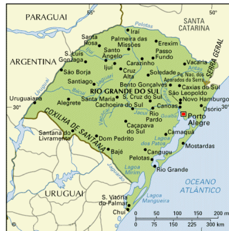
Mapa de Río Grande do Sul