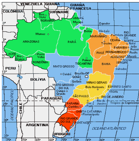
Mapa de Brasil