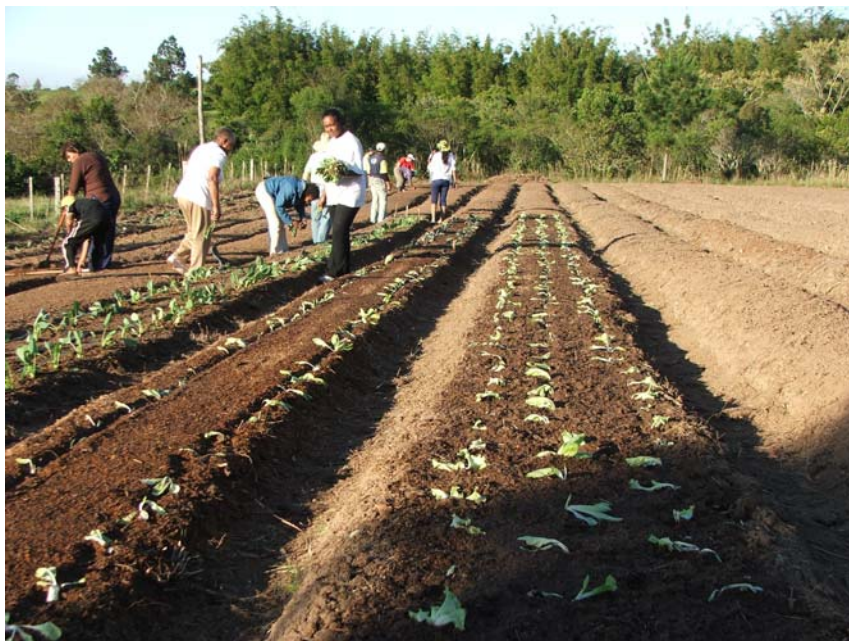
Les beneficiàries planten hortalisses durant la primera fase del projecte