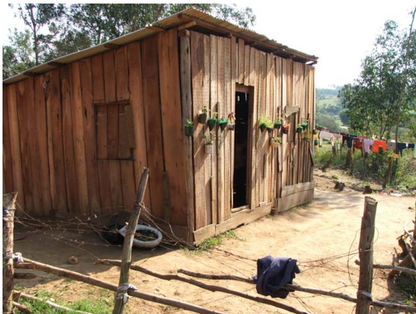
“Vivenda” d’una de les famílies beneficiàries del projecte