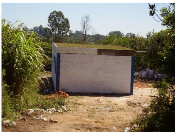
Edificació construïda en la primera fase del projecte des de diferents perspectives, annexa a l'hort, per magatzem d'eines agrícoles i aula formativa.

Associació de Cooperació Internacional Nord-Sud (CONOSUD). Inscrita en el Registre d'Associacions de la Generalitat de Catalunya, Secció 1 a , n. 33.811. NIF: G-64408990