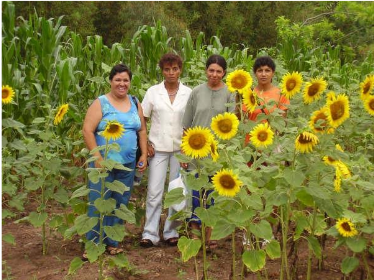
Algunes de les beneficiàries del projecte en el hort conreuat en la primera fase del projecte