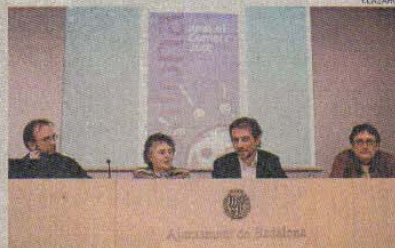
Inici. Els organitzadors de la campanya i el regidor Pera

comparteix el plantejament i treball de regidories i departaments, com medi ambient o cooperació, entre d'altres, i s'ha de fer entendre a l'àmbit de la gestió financera".