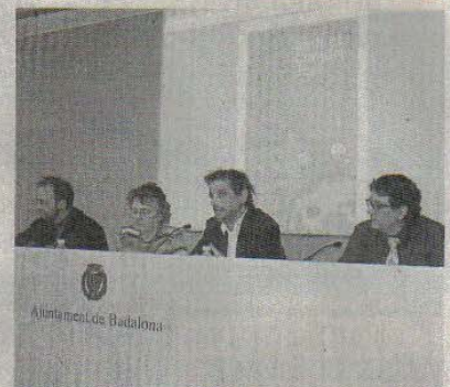
Pera presenta la campanya de comerç just. / M.M.

dran explicar de primera mà l'impacte que ha tingut en les seves comunitats la cooperació amb les entitats solidàries que s'ocupa de posar a l'abast els seus productes. La campanya de sensibilització inclou també una exposició itinerant que explicarà els valors, les característiques i la història de les finances ètiques, el comerç just i l'economia solidària.