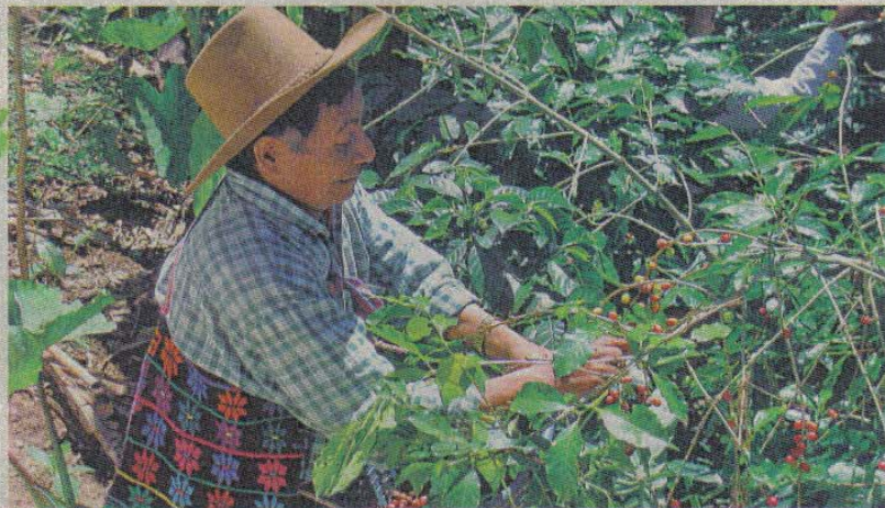
Comerç just. Ofereix als productors accés directe als mercats del nord amb unes condicions laborals i comercials justes