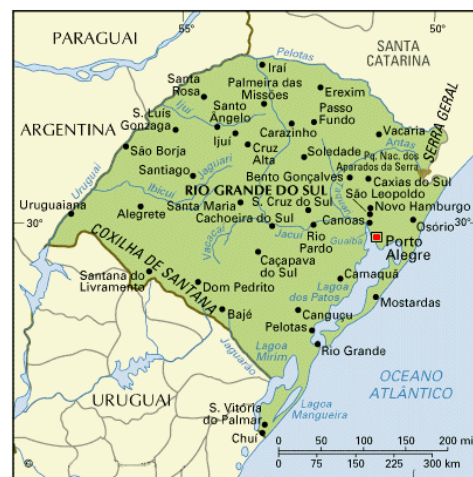
Mapa de Rio Grande do Sul