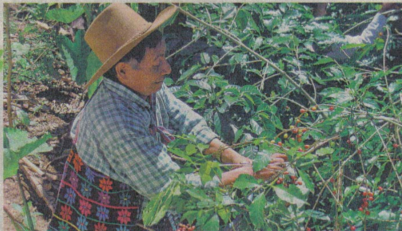
Comerç just. Ofereix als productors accés directe als mercats del nord amb unes condicions laborals i comercials justes