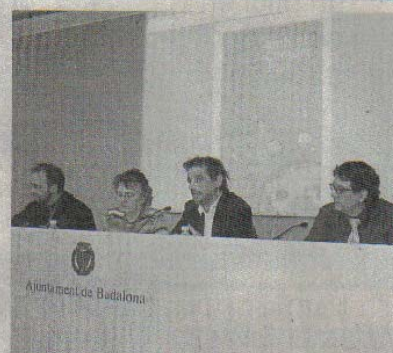
Pera presenta la campanya de comerç just. /M.M.

dran explicar de primera mà l'impacte que ha tingut en les seves comunitats la cooperació amb les entitats solidàries que s'ocupen de posar a l'abast els seus productes. La campanya de sensibilització inclou també una exposició itinerant que explicarà els valors, les característiques i la història de les finances ètiques, el comerç just i l'economia solidària.