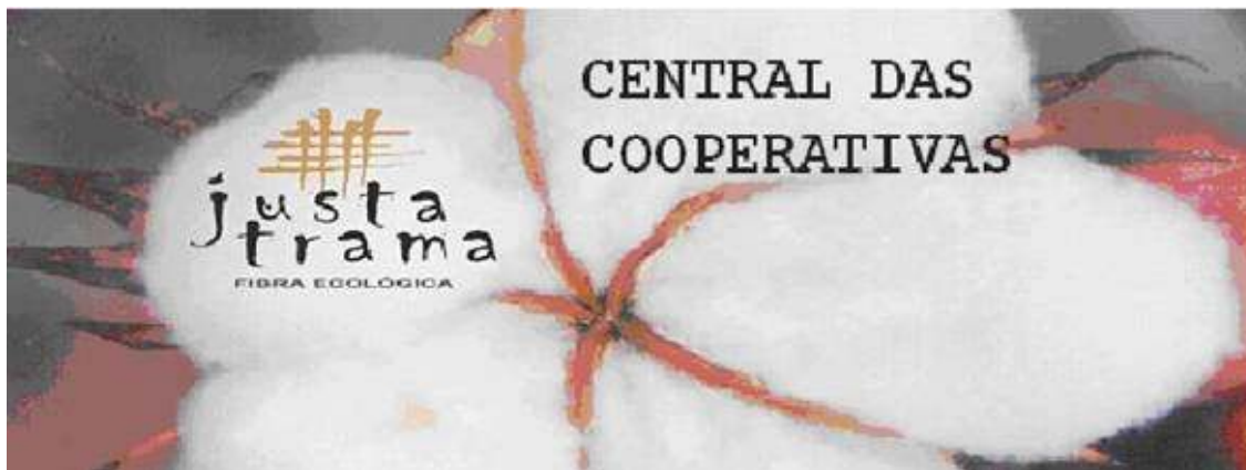
Imagen corporativa de la cadena productiva del algodón orgánico

El pasado día 2 de enero, CONOSUD recibió la notificación del acuerdo de la Junta de Gobierno de la Diputación de Barcelona del 13 de diciembre (publicado en el BOP del 24 de diciembre) por el que se aprobaba el Catálogo de Ofertas de actividades de sensibilización para los Ayuntamientos de Barcelona. El Catálogo de Ofertas es un instrumento creado por la Diputación de Barcelona para favorecer la realización en los municipios de Barcelona, por parte de las ONGDs, de actividades de sensibilización sobre los problemas del desarrollo y las desigualdades Norte-Sur. La financiación de estas actividades es conjunto entre la Diputación y el respectivo Ayuntamiento interesado en que se realicen las actividades incluidas en el Catálogo. En el Catálogo para 2008 la Diputación ha incluido el proyecto de actividad de sensibilización “Justa Trama” presentado por CONOSUD en la convocatoria pública realizada por esta Administración.