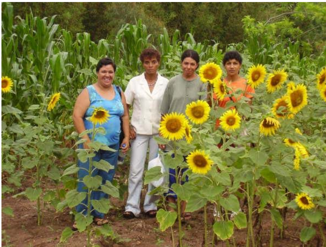
2.- Algunes de les dones beneficiàries del Projecte de Cerrito Alegre, municipi de Pelotas (RS-Brasil), en un dels horts cultivats per assegurar la seva alimentació bàsica

En la seva integralitat i mitjançant successives fases, el projecte persegueix la creació en terres cedides per particulars, d’un empeniment cooperatiu agro-pecuari i d’artesanía amb famílies (la majoria monoparentals i encapçalades per dones), que es troben en condicions molt precàries i en greu risc d’exclusió social, per tal de contribuir-hi a la seva inclusió social i al desenvolupament local del districte rural de Cerrito Alegre, on viuen 3.517 persones agrupades en 969 famílies . D’aquestes famílies, segons l’anàlisi dels organismes públics brasilers d’estadístiques (IBGE), el 15,38 % dels seus responsables no tenen cap renda i el 30,34% la tenen per sota del salari mínim brasiler (menys de 150 euros mensuals). Aquestes dades impliquen per tant que prop de la meitat de la població del districte rural de Cerrito Alegre està per sota dels llindars de la pobresa o en la pobresa severa i indigència, segons els paràmetres dels organismes internacionals.